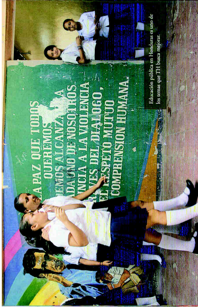
Educación pública en Honduras es uno de los temas que TH busca mejorar.