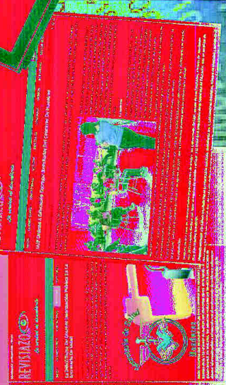
Las investigaciones profundas están a su disposición en nuestro sitio web: www.revistazo.com