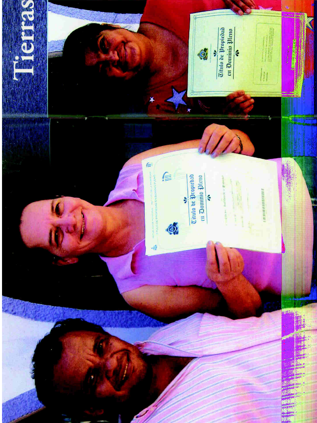
Más de 3,700 beneficiarios del proyecto de tierras reciben sus títulos de propiedad.

E l proyecto de Derecho a las Tierras educa y capacita a los pobladores en el conocimiento de la Ley de Propiedad y sobre cómo conseguir sus títulos de propiedad; también incide en el Estado para que aplique la misma ley con justicia y equidad.