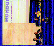
Participación de TH en el Congreso Nacional de Honduras, en el tema de las negociaciones magisteriales.