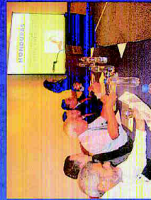
Mesa principal en una conferencia de prensa en el tema de la compra directa de medicamentos por parte de la Secretaría de Salud de Honduras.

Es un movimiento que lucha por la transformación de Honduras a través del empoderamiento de la sociedad y un sistema democrático más eficaz y eficiente, que mejora los servicios públicos de salud, educación, justicia y seguridad ciudadana y actúa con transparencia y sin corrupción en la reducción de la pobreza del país.