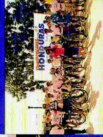
Costa a Costa es el primer evento de ciclismo con propósito que se realiza en Honduras.