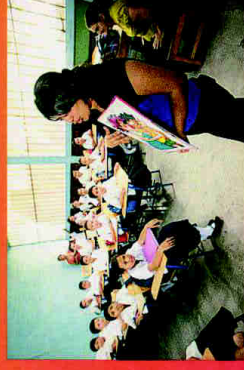
Niños reciben charla de prevención de abuso sexual.